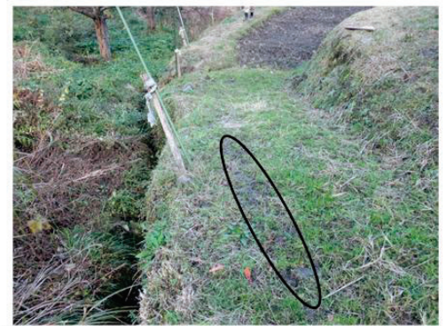
農道(幅はおよそ1.4m)を上から見たところ(稲田のところに木板を敷いていた)

道はもともと狭く(およそ1.4m)、小川側の縁は軟らかくて、車輪が食い込んだり、滑るため、それを防ぐために木の板(長さ3m、幅50cm、厚み7cmほど)を敷いていた。当日は降雨で板が濡れており、濡れた板の表面で前輪が川の方に横すべりして脱輪。