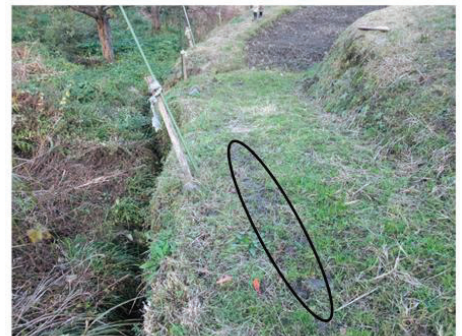
農道(幅はおよそ1.4m)を上から見たところ(楕円のところに木板を敷いていた)

道はもともと狭く(およそ1.4m)、小川側の縁は軟らかくて、車輪が食い込んだり、滑るため、それを防ぐために木の板(長さ3m、幅50cm、厚み7cmほど)を敷いていた。当日は降雨で板が濡れており、濡れた板の表面で前輪が川の方に横すべりして脱輪。