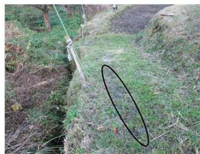
農道(幅はおよそ1.4m)を上から見たところ(楕円のところに木板を敷いていた)

道はもともと狭く(およそ1.4m)、小川側の縁は軟らかくて、車輪が食い込んだり、滑るため、それを防ぐために木の板(長さ3m、幅50cm、厚み7cmほど)を敷いていた。当日は降雨で板が濡れており、濡れた板の表面で前輪が川の方に横すべりして脱輪。