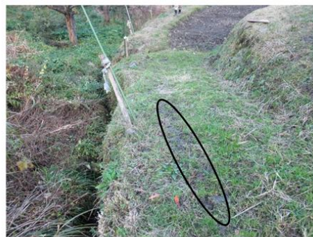
農道(幅はおよそ1.4m)を上から見たところ(楕円のところに木板を敷いていた)

道はもともと狭く(およそ1.4m)、小川側の縁は軟らかくて、車輪が食い込んだり、滑るため、それを防ぐために木の板(長さ3m、幅50cm、厚み7cmほど)を敷いていた。当日は降雨で板が濡れており、濡れた板の表面で前輪が川の方に横すべりして脱輪。