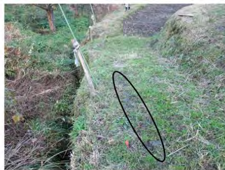
農道(幅はおよそ1.4m)を上から見たところ(楕円のところに木板を敷いていた)

道はもともと狭く(およそ1.4m)、小川側の縁は軟らかくて、車輪が食い込んだり、滑るため、それを防ぐために木の板(長さ3m、幅50cm、厚み7cmほど)を敷いていた。当日は降雨で板が濡れており、濡れた板の表面で前輪が川の方に横すべりして脱輪。