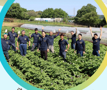
東京農業アカデミー 八王子研修農場

新規就農者を育成する東京農業アカデミーと、その卒業生の農園を訪問し、就農に向けた準備や就農後のイメージをリアルに感じていただくツアーを実施します。東京での就農を考えている方はぜひご参加ください！