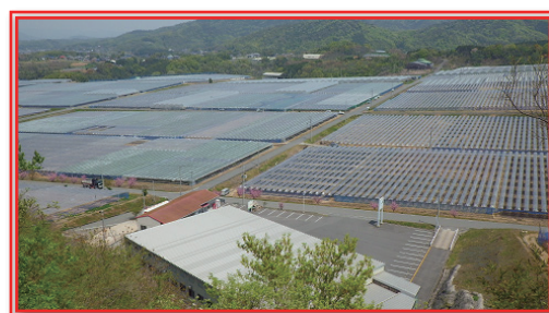
研修農園がある沼隈ぶどう団地

また、優良農地の有効活用や、条件の良い耕作放棄地の再生等により、収益性の高い果樹農業のモデル経営の実証等による担い手研修生の経営目標の設定支援や、成園過程の農地の集積や改植等のノウハウを集積しています。